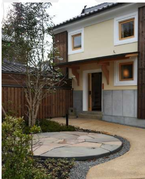
中庭「太陽の食卓」 Courtyard "Table of the Sun"

素材 Material・・・小豆島産鉄平石 Stone from Shodoshima Island